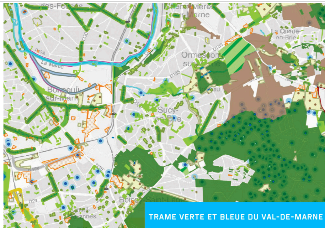
TRAME VERTE ET BLEUE DU VAL-DE-MARNE